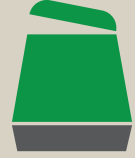
গৃহস্থালী কম্পোস্ট তৈরি

AIM Ambiente ভিসেঞ্জা ডিস্ট্রিক্ট কাউন্সিল এলাকার অধিবাসীদেরকে বিনামূল্যে কম্পোস্টার প্রদান করে। কম্পোস্টারের জন্য যেসব নম্বরে ফোন করবেন: 0444 394008 বা 0444 0444 বা ইমেইল করবেন এই ঠিকানায়: infoporta.porta@aimvicenza