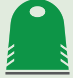
রাস্তার পাশের রিসাইক্লিং ব্যাঙ্ক

আবাসিক এলাকার ওপর ভিত্তি করে সংগ্রহ পদ্ধতি ভিন্ন হয়। স্থান ও রাস্তার বিন্যাসের ওপর ভিত্তি করে শহরের ঐতিহাসিক কেন্দ্রে সবুজ রিসাইক্লিং ব্যাঙ্ক, বা সবুজ হুইল বিন রয়েছে।