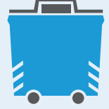
বাস্তার পাশের রিসাইক্লিং ব্যাঙ্ক