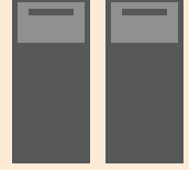
রাস্তার পাশের রিসাইক্লিং ব্যাক্স

ব্যবহৃত ব্যাটারি ও মেয়াদোত্তীর্ণ ওষুধ ফ্লাপ যুক্ত ধূসর পাত্রে ফেলা যাবে, যা সাধারণত ওষুধ বা সিগারেটের দোকানে বিদ্যমান। ওষুধ ও ব্যাটারি (মোবাইল ফোন, ঘড়ি ইত্যাদির হলেও) রিসাইক্লিং কারখানাতেও নিয়ে যাওয়া যায়।