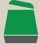
গৃহস্থালী কম্পোস্ট তৈরি

AIM Ambiente ভিসেঞ্জা ডিস্ট্রিক্ট কাউন্সিল এলাকার অধিবাসীদেরকে বিনামূল্যে কম্পোস্টার প্রদান করে। কম্পোস্টারের জন্য যেসব নম্বরে ফোন করবেন: 0444 394008 বা 0444 0444 বা ইমেইল করবেন এই ঠিকানায়: infoporta.porta@aimvicenza