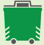
রাস্তার পাশের ছইলিবিন