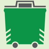
রাস্তার পাশের ছুইলিবিন