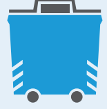
বাস্তার পাশের রিসাইক্লিং ব্যাঙ্ক