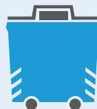
Poubelle de rue