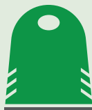
Kontejneri za reciklažu pored puta

Sistem za sakupljanje se razlikuje u zavisnosti od stambene oblasti. U zavisnosti od prostora i rasporeda puta, u istorijskom centru grada su postavljeni zeleni kontejneri za reciklažu i zelene kante.