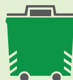
Kante pored puta