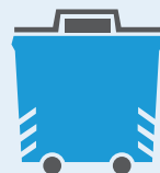
Kontejneri za reciklažu pored puta