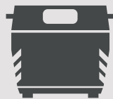
Kontejneri za reciklažu pored puta

Pentru informații: infoporta.porta@aimvicenza.it