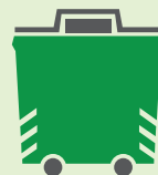
Kante pored puta