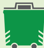
Contenedor de vía pública