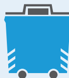
Contenedor de vía pública