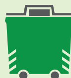
Contenedor de vía pública