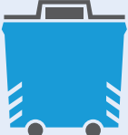
حاويات إعادة التدوير بجانب الطريق