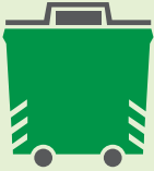
الحاويات ذات العجلات على جانب الطريق