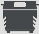
حاويات إعادة التدوير بجانب الطريق